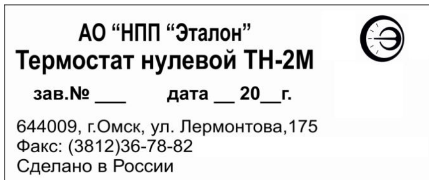
Рисунок А.1 – Этикетка термостата нулевого ТН-2М